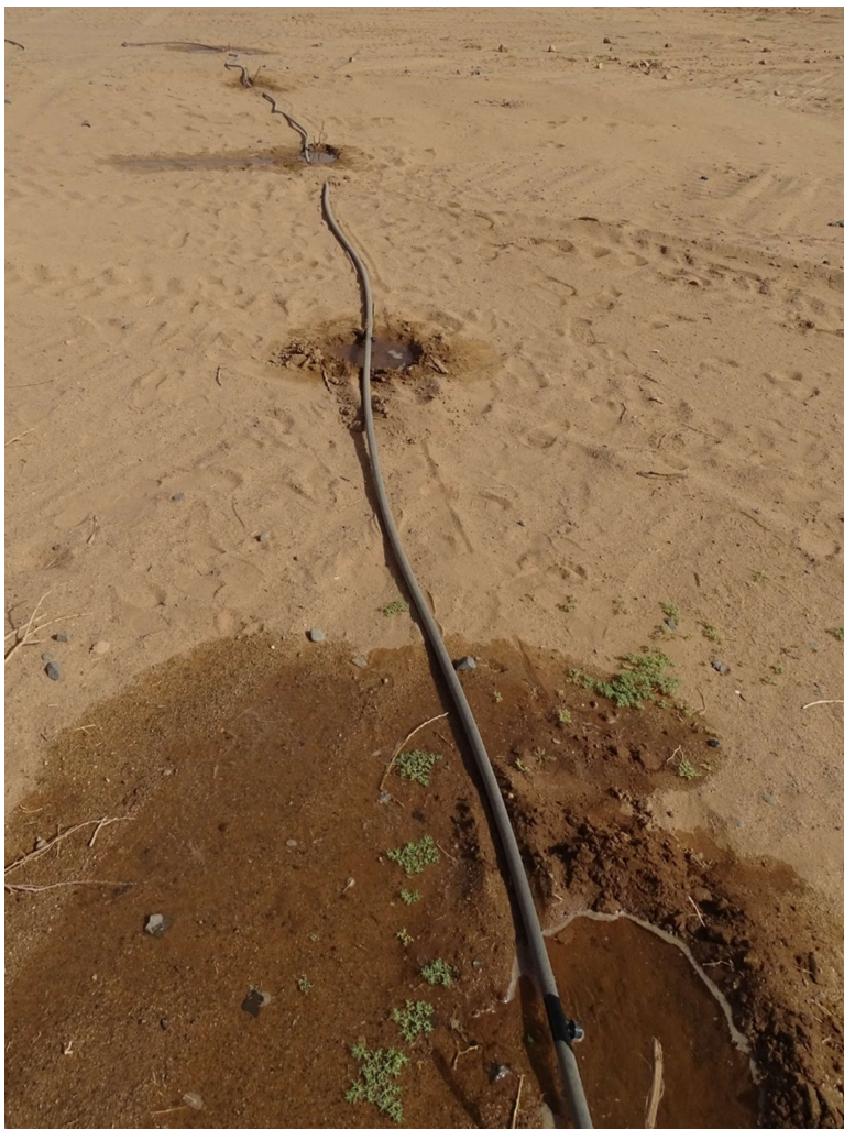
Abb. 22: Falsch verstandene Tropfbewässerung in der Umgebung von Bardai. März 2021.

Wenngleich das Perlschlauch-System in der Hauptstadt N'Djamena erfolgreich eingesetzt wird, so scheint es im Tibesti nicht leicht akzeptiert zu werden. Das mag daran liegen, dass das Wasser bei der Unterflurbewässerung größtenteils nicht zu sehen ist, weshalb die Perlschläuche in mehreren Fällen als „verstopft“ bezeichnet wurden. Dies konnte allerdings eine von ecotube durchgeführte Überprüfung von Probestücken, die im März 2023 im Tibesti genommen wurden, nicht bestätigen, und die Schläuche scheinen durchaus funktionstüchtig zu sein. Wahrscheinlich kommen hier unterschiedliche kulturellen Auffassungen von „Bewässerung“ ins Spiel. Wasser müsse für die Einwohner fließen und sichtbar sein, kommentierte dazu ein in Bardai tätiger Mitarbeiter der Entwicklungszusammenarbeit. Eine weitere Beobachtung ergänzt diesen Kommentar: Dort, wo Tropfbewässerung eingesetzt wird, wird diese oft erst dann als „gut“ funktionierend betrachtet, wenn unter den Tropfern Wasserlachen stehen ( Abb. 22 ). In diesem Zusammenhang wäre eine weitere Sensibilisierung notwendig.