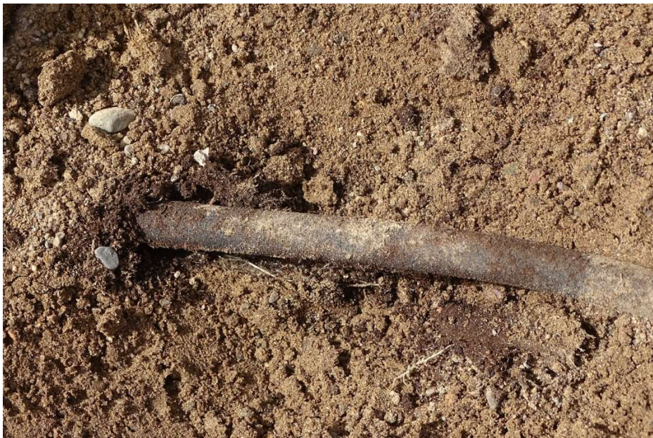
Abb. 19: Freigelegtes Teilstück eines Perlschlauchs. Surdoge, März 2022.

Zur Einrichtung der Unterflurbewässerung wurde ein stark meterhoher Sockel aus Zementziegeln erstellt und darauf eine Kunststoff-Zisterne platziert (je nach lokaler Verfügbarkeit 1.000-2.000 l), so dass durch Schwerkraft und in Abhängigkeit vom Füllstand ein Druck von mindestens 0,1 bar erzeugt wird. Von der Zisterne wird über einen ¾“-Schlauch und über einen Filter Wasser in zwei separat verlegte Perlschläuche eingespeist, die jeweils 25 m lang sind ( Abb. 19 ). Je nach Kultur wurden die Schläuche mindestens 15 cm tief in der Erde verlegt. Die Perlschläuche laufen durchgehend jeweils in 3-4 Bahnen von entsprechender Länge. 8 Der Abstand der Bahnen zueinander ist variabel, in Abhängigkeit von den angebauten Pflanzenarten.