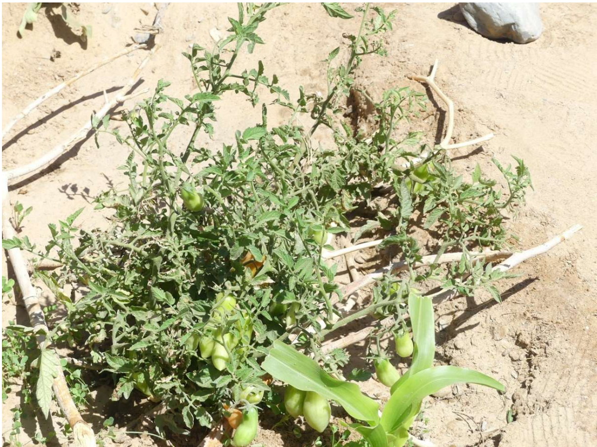
Abb. 27: Die Flaschentomate „San Marzano“ und eine Maispflanze der Sorte „Tramunt“. Unter der Tomatenpflanze sind Ästchen ausgebreitet, damit Blätter und Früchte beim Wässern nicht befeuchtet werden. März 2023.

Besonders bewährt, bezüglich Ertrag und Robustheit, hat sich im Tibesti die Flaschentomate „San Marzano“ ( Abb. 27 ), gefolgt von den offenbar weniger robusten Sorten „Hellfrucht“ und „Tica“.