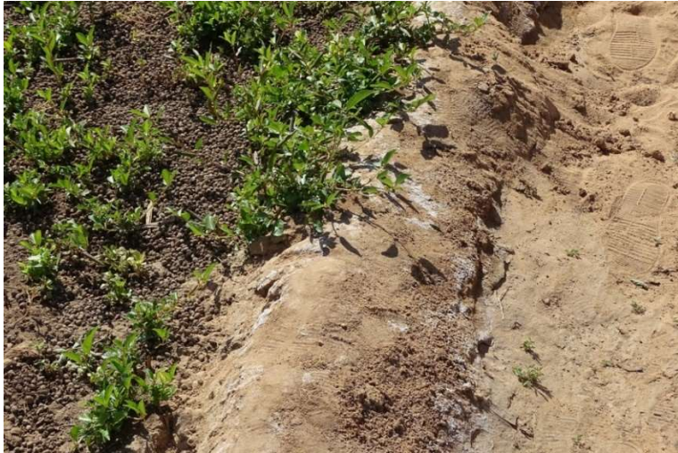
Abb. 14: Natriumcarbonat-Verbindungen, die auf den Dämmen eines Luzerne-Beets auskristallisiert sind. Das Beet ist mit Ziegenkot gedüngt. Umgebung von Bardai, November 2021.

das Wasser im Tibesti, im Vergleich zu Süßwasser anderer Gegenden, einen hohen Mineralgehalt aufzuweisen. Es ist eine Art Süßwasser, "das mit einem Zusatz von \text{NaHCO}_3 und \text{NaCl} versehen ist" (SCHINDLER & MESSERLI 1972: 148). 4 ) Zum zweiten Problem, der Absenkung des Grundwasserspiegels, kommt es durch Übernutzung der Wasserressourcen. Ein Beispiel dafür ist das Air-Gebirge in der Republik Niger mit seinem florierenden Gartenbau (vgl. ANTHELME ET AL. 2006: 9).