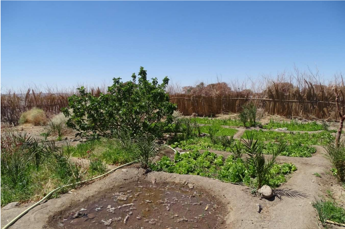
Abb. 29: Ein Garten in Odorko mit zukünftigem Stockwerkanbau: Zwiebel- und Salatbeete, viele jungen Dattelpalmen und ein Feigenstrauch. März 2022.

Das Projekt unterstützte und unterstützt die Gärtner ebenfalls mit der Anpflanzung von Obstbäumen und -sträuchern, wie Zitrone ( Citrus x limon ), Granatapfel ( Punica granatum ) und Feige ( Ficus carica ), sowie mit Weinreben ( Vitis vinifera ). Diese Arten sind bereits in zentralsaharischen Oasen vertreten und gedeihen dort gut. Bei den Zitronenbäumen handelt es sich um Sämlinge, da veredelte Obstbäume, selbst auf dem Markt der Hauptstadt N’Djamena, nicht zu erhalten sind. Ob die Gärtner auf Dauer Erfolg mit Mangobäumen ( Mangifera indica ) und Bananenstauden ( Musa x paradisiaca ) haben werden, die einige von ihnen selbst einführen und die stellenweise in der Zentralsahara auch fruchten, wird sich erst noch zeigen.