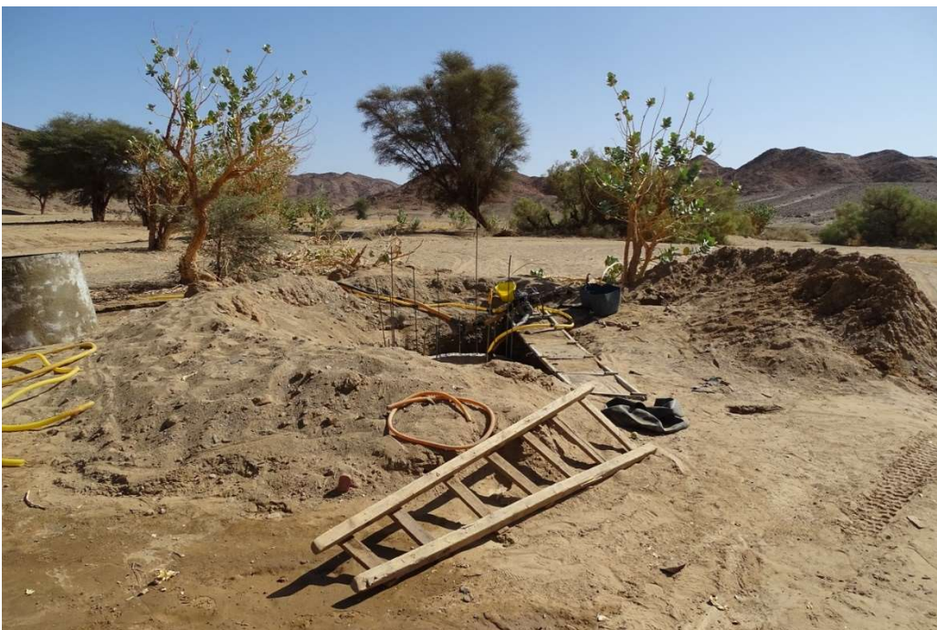
Abb. 12: Bau des Brunnens von Hochi mit Aushubhügeln. Aus der Wand der Brunnenröhre ragt Armierungsstahl für den Weiterbau heraus. Am linken Bildrand sind Teile der Gussform zu erkennen. November 2021.

Beim Bau eines offenen Brunnens ( Abb. 12 ) wird manuell ein Schacht bis zum ersten Auftreten von Wasser gegraben. Darauf wird mit dem Guss der Brunnenwand aus Beton begonnen. Hat die Wand die Erdoberfläche erreicht, wird gleichmäßig weiter gegraben, bei gleichzeitigem Abpumpen des Wassers, sobald dieses eintritt. Die Wand in Form einer Röhre sinkt durch ihr Eigengewicht mit dem Fortschreiten des Schachts nach unten.