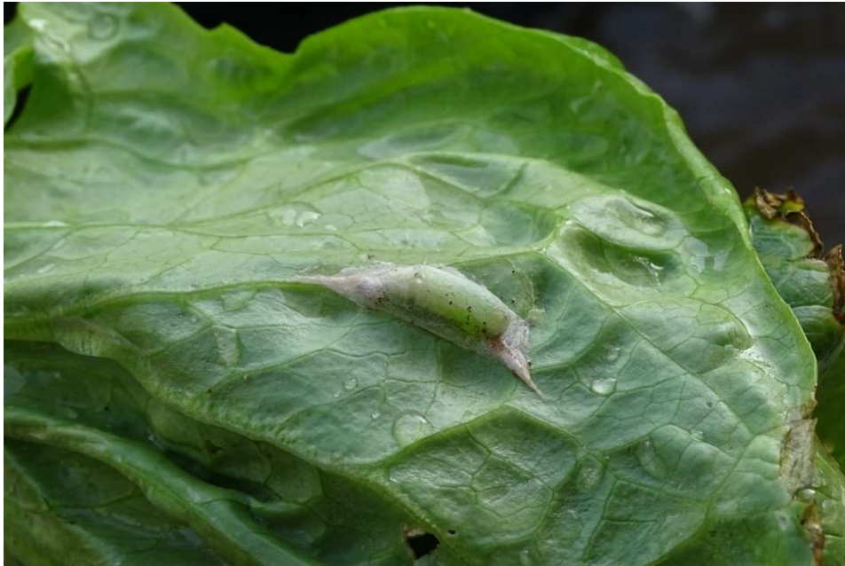
Abb. 24: Raupe einer Nachteulen-Art ( Lacanobia sp.) in ihrem Gespinst an einem Salatblatt in Odorko. März 2021.

von Insektenbefall beschädigten Früchte. Vor allem Tomaten, aber auch Auberginen ( Solanum melongena ), Paprika ( Capsicum annuum ) und Salat werden von Raupen einer Nachteulenart ( Lacanobia sp.) befallen, die zuerst an den Blättern, und dann, wo vorhanden, an den Früchten fressen ( Abb. 24 ).