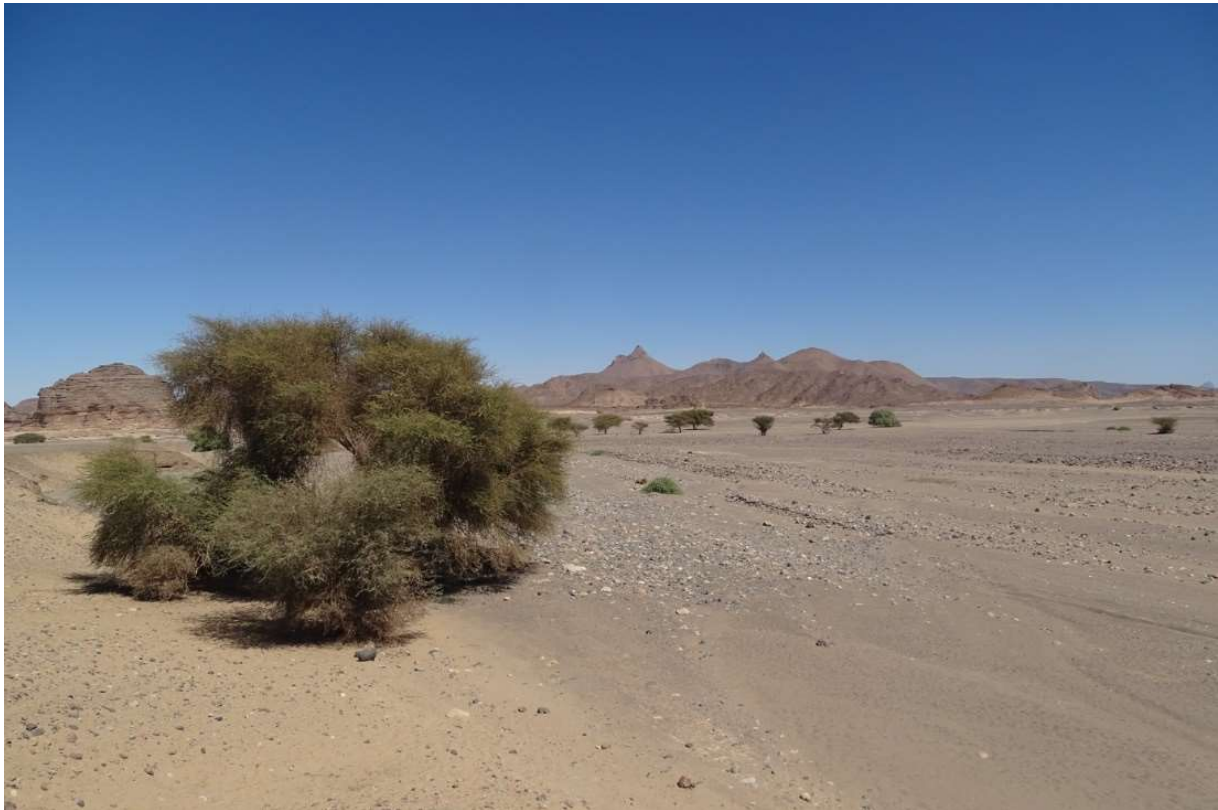
Abb. 8: Der Weg von Bardai nach Zoui nahe Surdoge. Oktober 2020.

Surdoge ( Abb. 8 ) liegt im Osten von Bardai, auf dem Weg nach Zoui. Letzteres war bis in die 1970-er Jahre ein Hauptort für Dattelnkultur und Gartenbau im Tibesti (vgl. SAINT-SIMON 1952).