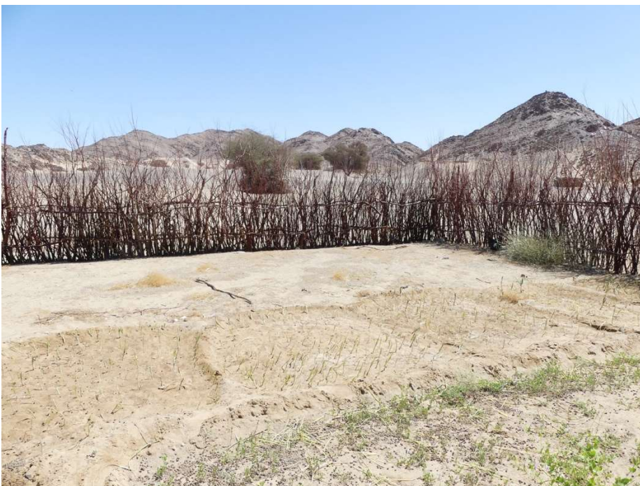
Abb. 4: Ein Garten von Hochi mit Zwiebelbeeten im Vordergrund. Einige Beete sind mit Ziegenkot gedüngt. Wie viele Gärten ist auch dieser von einem Zaun aus Tamarisken-Zweigen umgeben. März 2023.

Die Saharagärten sind ein partizipatives Projekt und nicht „von außen“ implementiert. Sie wurden in ihrer Anfangsphase (Januar bis April 2021) zusammen mit Einwohnern konzipiert, die teilweise auch materiell zum Projekt beitrugen, so zum Beispiel durch das Beschaffen von Sand und Schotter aus der Umgebung zum Brunnenbau oder durch das Erstellen traditioneller Zäune aus Palmwedeln oder Tamarisken-Zweigen ( Abb. 4 ).