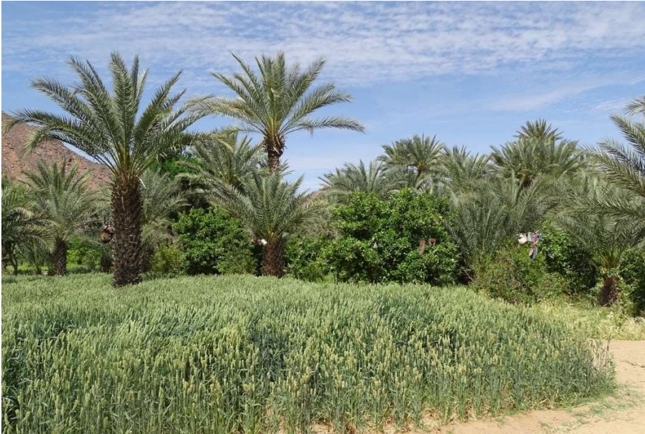
Abb. 3: Typischer Stockwerkanbau im Air-Gebirge (Timia / Republik Niger) mit Getreide, Zitrusfrüchten und Dattelpalmen. Die an einer durch die Bildmitte verlaufenden Linie aufgehängten Stoffnetzen und Blechgegenstände dienen als Vogelscheuchen. März 2019.

Die Saharagärten sind ein partizipatives Projekt und nicht „von außen“ implementiert. Sie wurden in ihrer Anfangsphase (Januar bis April 2021) zusammen mit Einwohnern konzipiert, die teilweise auch materiell zum Projekt beitrugen, so zum Beispiel durch das Beschaffen von Sand und Schotter aus der Umgebung zum Brunnenbau oder durch das Erstellen traditioneller Zäune aus Palmwedeln oder Tamarisken-Zweigen ( Abb. 4 ).