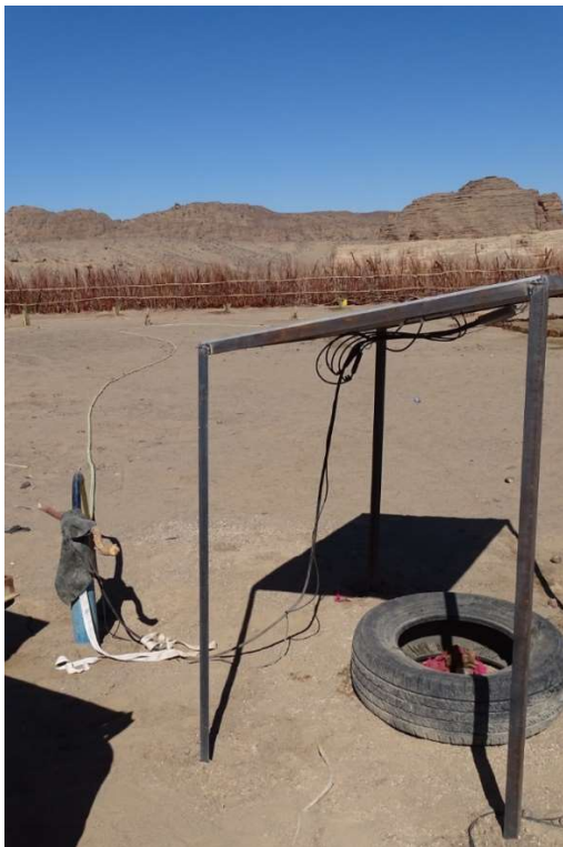
Abb. 17: Das Bohrloch von Surdodge mit hineingehängter Tauchpumpe und Solarpanels. Man erkennt das schwarze Hartplastikrohr an der Oberkante des Brunnenrohrs, um den Pumpenschlauch gegen Abknicken zu sichern. Im Hintergrund eine frisch angelegte Dattelpflanzung. März 2022.

Rechnet man jedoch mit acht Sonnenstunden und 1,9 m 3 Förderleistung pro Stunde, so ist man mit mehr als 15 m 3 am Tag in einer Größenordnung, die denen, welche bereit sind, althergebrachte Bewässerungsmethoden zu ändern, das Wässern mehrerer Kleingärten erlaubt. So zum Beispiel geben WOLTERING ET AL. (2011: 614-15) für ihr Modell des Commercial African Market Garden mit 500 m 2 Fläche als – wahrscheinlich für den gegenwärtigen geographischen Kontext zu gering bemessene – Richtgröße für den Wasserbedarf bei Tröpfchenbewässerung 4 m 3 Wasser pro Tag an. Wie bereits erwähnt, stellen 500 m 2 bereits die Obergrenze für einen Kleingarten, wie ihn das Projekt konzipierte, dar.