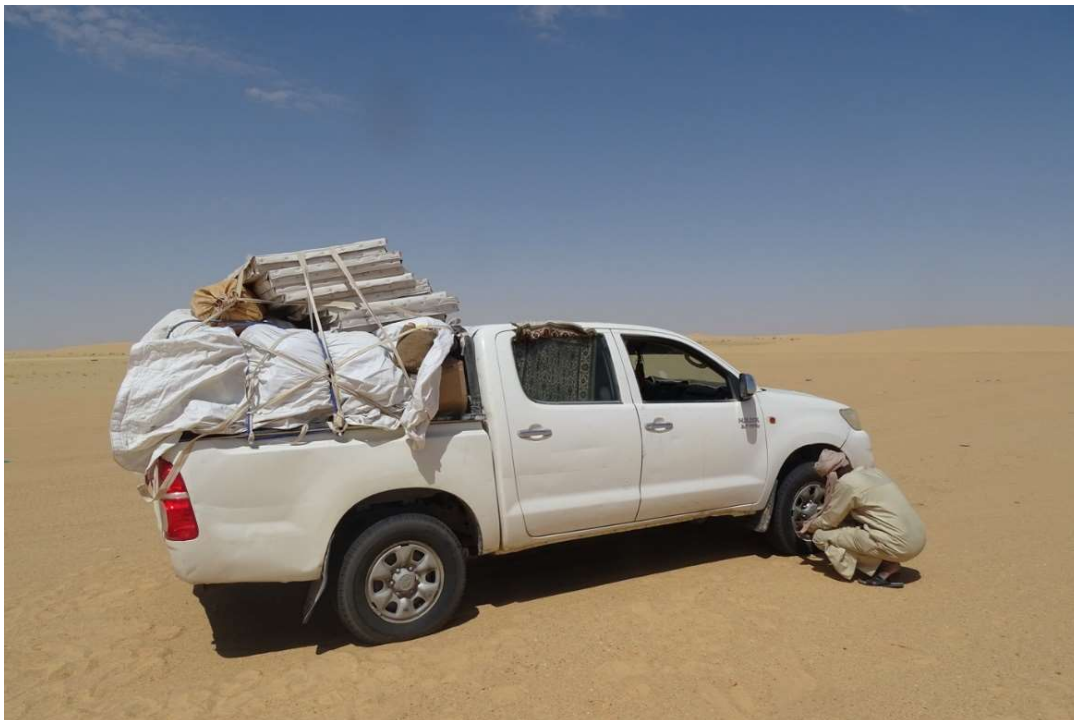
Abb. 1: Materialtransport durch die Djurab-Wüste im Süden von Faya. Um im Sand nicht stecken zu bleiben, muss der Reifendruck verringert werden. Oktober 2021.

Keine hundert Kilometer nördlich von N'Djamena, der Hauptstadt der Republik Tschad in Zentralafrika, endet die asphaltierte Straße. Wer von hier weiter in das zentralsaharische Tibesti-Gebirge im fernen Nordwesten des Landes fahren will, wird noch weitere 1.600 Kilometer auf unbefestigten Pisten durch die Wüste reisen. Diese führen zuerst durch Landschaften des nördlichen Sahel mit ihrer im Laufe der Fahrt immer spärlicher werdenden Vegetation. Darauf gelangt der Reisende in Gegenden, die von Sand ( Abb. 1 ) oder von Diatomit, einem Seesediment, geprägt sind, bis er nach Faya kommt, dem Hauptort der Provinz Borku.