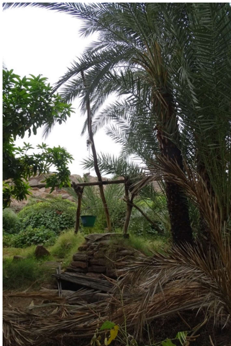
Abb. 15: Schöpfbrunnen in der Oase Goubon im Zentralstibesti. November 2019.

Bei der „traditionellen“ Bewirtschaftung eines Oasengartens im Tibesti und an anderen Orten der Zentralsahara wird oft mit dem Schöpfbrunnen ( Schaduff ) Wasser gefördert ( Abb. 15 ).