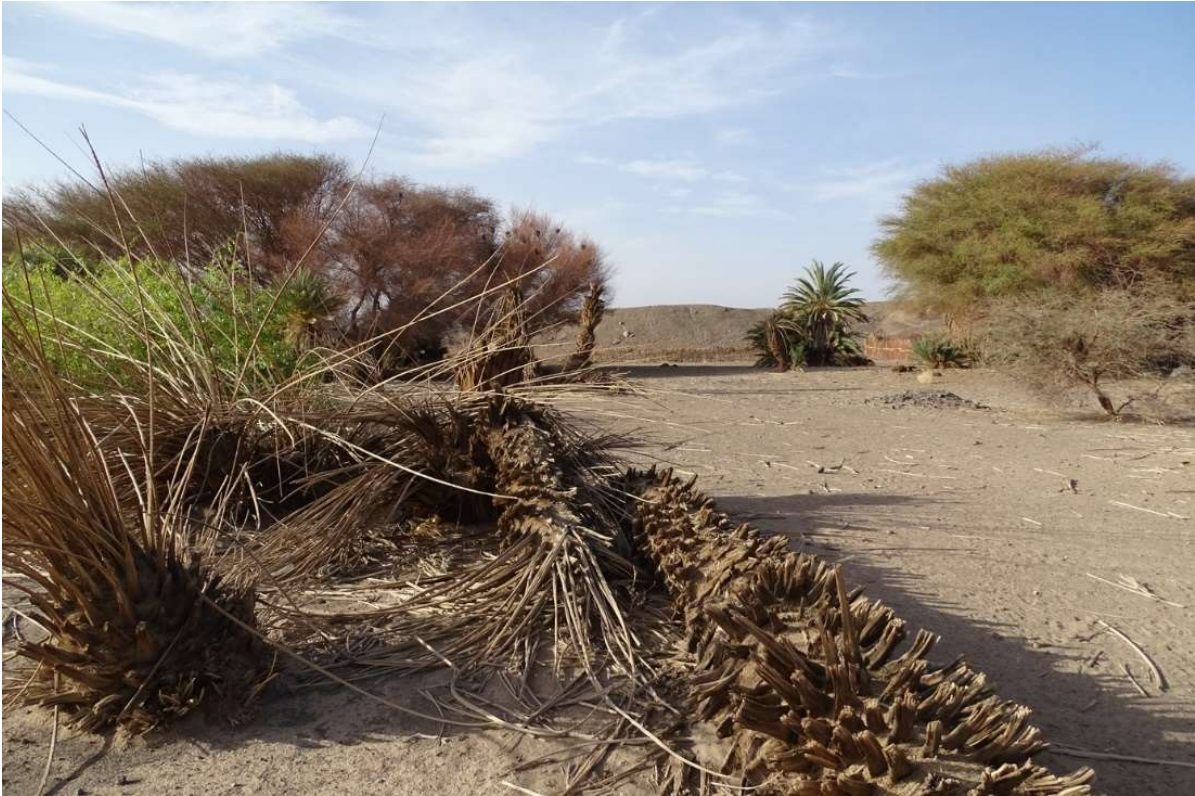
Abb. 9: Ehemaliges Gartenland von Odorko mit verdorrten Dattelpalmen. Die Akazien im linken Bildhintergrund sind von einer Art Gespinstmotte kahlgefressen. März 2021.

Erst seit dem Jahr 2018 stieg der Grundwasserspiegel wieder, zuerst auf 6 m und bis 2021 auf ein Niveau von stellenweise nur 3 m. Die Umgebung ist geprägt von einer Vegetation aus A. tortilis ssp. raddiana , Tamarix sp. und S. persica . Ein Brunnenprofil eines ungemauerten 6,3 m tiefen Brunnens zeigte eine Wechschichtung aus Sand und Kies sowie Geröllen, deren Hauptmaterialien Basalt und Tuff waren (SCHINDLER & MESSERLI 1972: 146). Beim rezenten Brunnenbau traten tonhaltiger Sand, dann Sand und Kies zu Tage.