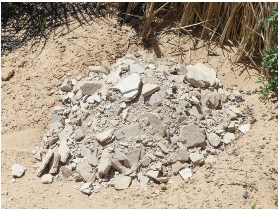
Abb. 26: Seesedimente, die ein Gärtner als Dünger in seinen Garten in Nord-Borku gebracht hat. März 2023.

Auch wird von Gärtnern, insbesondere von denen, welche die libysche Landwirtschaft kennen, immer wieder der Wunsch nach Kunstdünger geäußert, obwohl lokale organische und anorganische Naturdünger in genügendem Maße vorhanden sind. Als ausgezeichnete Dünger gilt der Kot des im Tibesti zahlreich vorkommenden Klippschliefer ( Procapra capensis ). Dazu kommt Ziegenkot, der in rohem Zustand über die Beete gestreut wird (s. o. Abb. 4 + 14). Lokaler anorganischer Dünger besteht aus Seesedimenten ( Abb. 26 ).