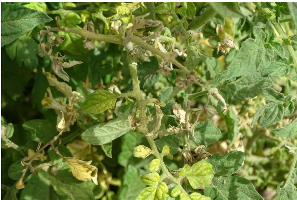
Abb. 25: Alternaria ähnelnde Schadbilder an Tomaten von Odorko. März 2021.

Tomaten weisen dazu häufig weitere Krankheitssymptome auf (trockene Flecken auf Stängeln und Blättern, dunkelbrauner Fleck an der Fruchtbasis), die denen ähneln, welche von Pilzen der Gattung Alternaria erzeugt werden ( Abb. 25 ).