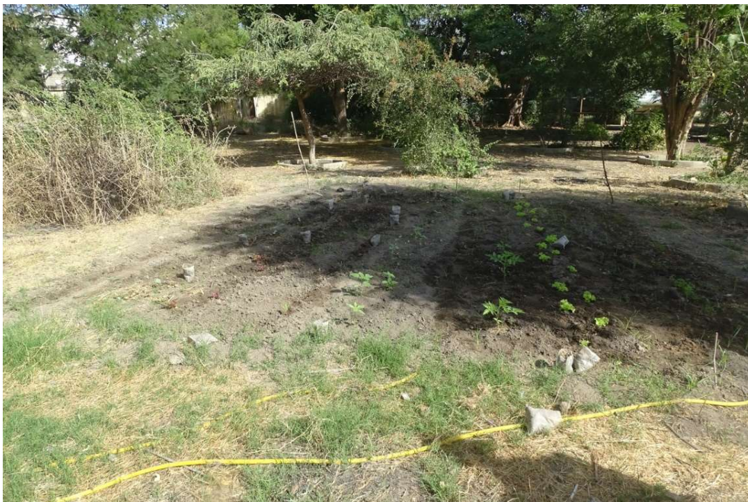
Abb. 21: Versuchsbeet im Schaugarten des CNRD in N'Djamena. In der Mitte Sonnenblumen einer „Blühstreifenmischung“. Man erkennt stellenweise den verlegten Perlschlauch anhand der durch ihn befeuchteten Erde. Rechts wurde wahrscheinlich zusätzlich gegossen. Dezember 2022.

Projekt, das in einer äußerst schwer zugänglichen und fern von der Hauptstadt gelegenen Region durchgeführt wird, einem größeren städtischen Publikum bekanntzumachen und dabei auch Entscheidungsträger zu erreichen. Die Problematik des ressourcenschonenden Umgangs mit Wasser und die Notwendigkeit einer stärkeren Hinwendung zu robusten, leicht weitervermehrten Kulturpflanzen aus samenfestem Saatgut bestehen ungeachtet der unterschiedlichen Umweltbedingungen auch in den südlichen Provinzen der Republik Tschad, wo Gartenbau und Landwirtschaft stellenweise weit verbreitet sind.