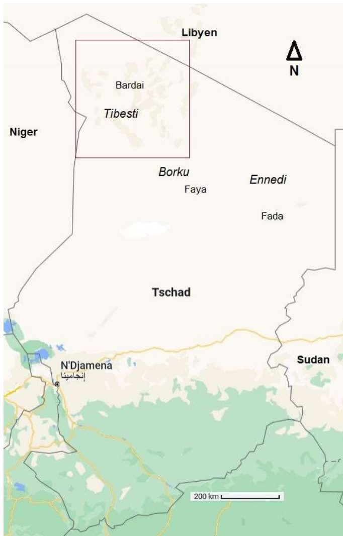
Abb. 2: Der Tschad - Zentralafrika

Bis hierher hat er in meist eineinhalb bis zweitägiger Fahrt etwas mehr als 1.000 Kilometer zurückgelegt. Der Weg führt ihn nun weiter nach Nordwest, zuerst durch staubige Diatomit-Landschaften, dann durch Sand- und Kieswüste und schließlich durch die Berge. Nach dieser ungefähr 460 Kilometer langen Reise, deren reine Fahrtzeit oft 12 Stunden oder mehr beträgt, gelangt der Reisende nach Zouar 1 im Tibesti. Vor ihm liegt nun noch eine unbefestigte Gebirgspiste von ungefähr 200 Kilometern Länge, die weitere 12 Stunden Fahrtzeit in Anspruch nehmen kann (s. u. Abb. 30 ). Dann erreicht er Bardai, den Hauptort der Provinz Tibesti und des gleichnamigen Gebirges ( Abb. 2 ).