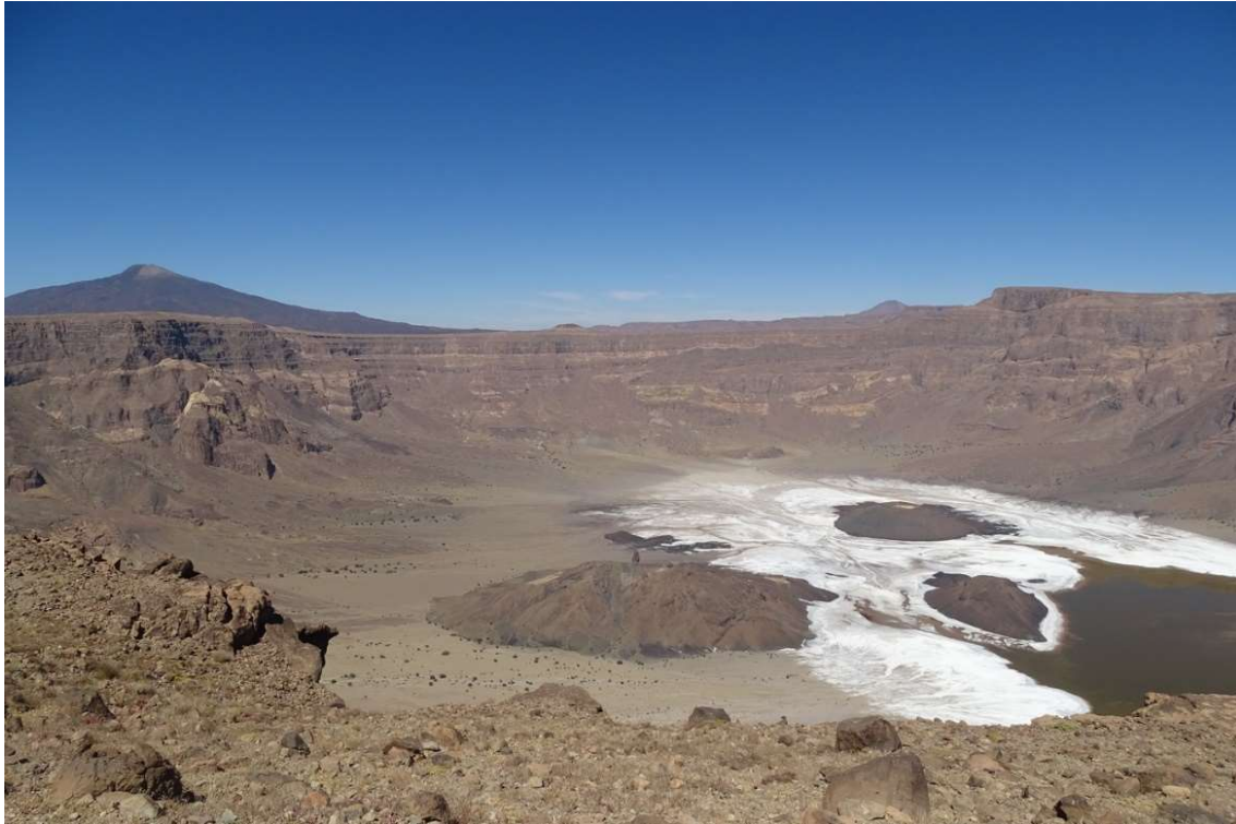
Abb. 5: Die Caldera des Natronlochs im Tibesti mit holozänen Sekundärvulkanen. Der Grund der Caldera ist stellenweise mit Natriumcarbonat-Verbindungen bedeckt. Im Hintergrund der Emi Tousside, mit seinen 3.265 Metern einer der höchsten Berge der Zentralsahara. November 2017.

In den Oasen des Tibesti bauten früher deren Bewohner, die zu den Tubu Teda gehören, Tomaten ( Solanum lycopersicum ) und Getreide, wie Perlhirse ( Pennisetum glaucum ) und Weizen ( Triticum sp. ) an (vgl. ROSTANKOWSKI 1982) und kultivierten Dattelpalmen (vgl. CHAPELLE 1982: 192). Gerade die Vielfalt der lokalen robusten Dattelvarietäten des Tibesti, wie auch die anderer Orte der Zentralsahara (vgl. MUSCH 2018, 2021a), verdient Aufmerksamkeit, da sie einen erhaltenswerten Genpool darstellt. Mit dem Ertrag dieser Kulturen versorgte früher das Tibesti den Süden Libyens. Aufgrund von Abwanderungen, die bereits in den 1960-er Jahren begannen, und 1968 einsetzenden Kriegswirren, geriet der Gartenbau jedoch größtenteils in Vergessenheit. Ihre frühere gartenbauliche Tradition war eines der Kriterien bei der Auswahl der Projektstandorte.