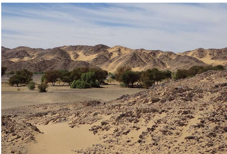
Abb. 7: Das Tal von Hochi. November 2021.

Hochi liegt in einem Wadi im Nordwesten von von Bardai ( Abb. 7 ), unweit der traditionellen Datteloase Ohudi. Aus dieser stammt die begehrte Dattelvarietät egeneši , die als eine der besten im gesamten Tibesti gilt. In Hochi befanden sich im Jahr 2021 bereits ein oder zwei verwilderte Gärten. Viehhalter der Hochflächen des Tarso Tousside nutzen die Wasserstellen um Hochi und seine Weidemöglichkeiten während der heißen und trockenen Jahreszeit (März bis Juni). Die Baumvegetation um Hochi ist geprägt von Acacia tortilis ssp. raddiana und Tamarix sp. Der Boden besteht aus einer dünnen Schicht feinen Sands, gefolgt von Ton und Sand in unterschiedlichem Mischverhältnis und (fast) reinem Ton. Darauf folgen Schichten von Sand unterschiedlicher Körnung vermischt mit Kies.