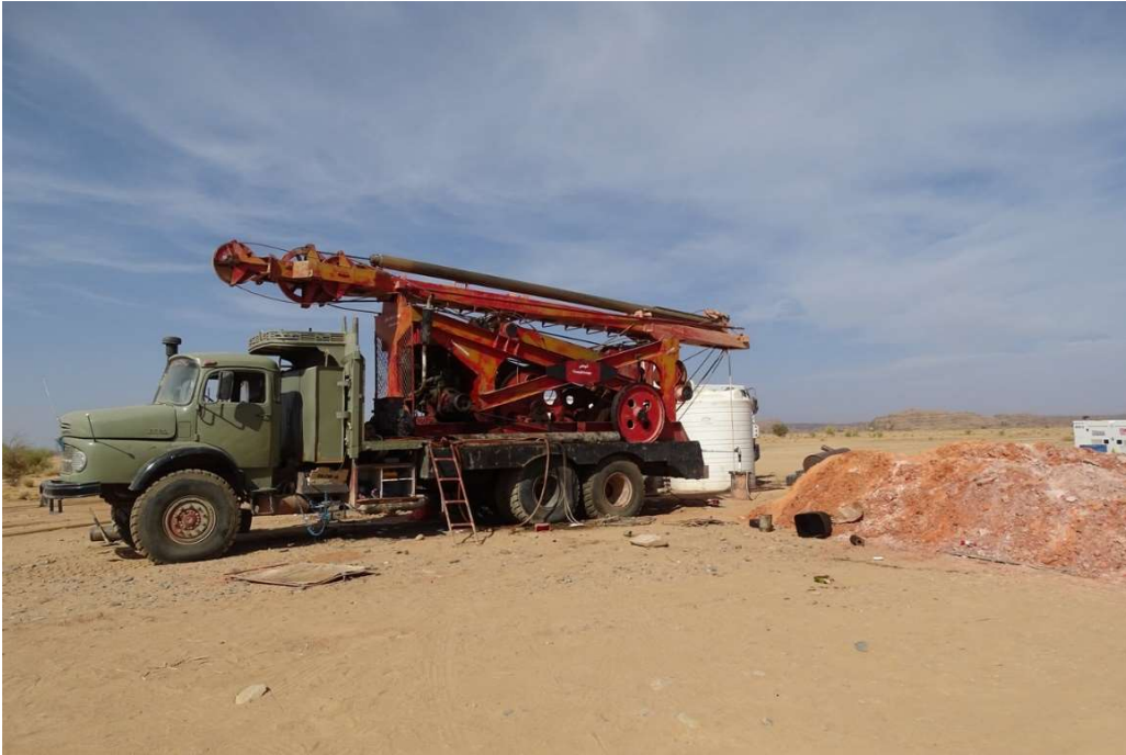
Abb. 11: Maschine zum Bau von Tiefbrunnen neben begunnenem Brunnen. Solche Tiefbrunnen hat das Projekt nicht angelegt. Wadi Taw (nahe Zouar), November 2021.

Beim Bau eines offenen Brunnens ( Abb. 12 ) wird manuell ein Schacht bis zum ersten Auftreten von Wasser gegraben. Darauf wird mit dem Guss der Brunnenwand aus Beton begonnen. Hat die Wand die Erdoberfläche erreicht, wird gleichmäßig weiter gegraben, bei gleichzeitigem Abpumpen des Wassers, sobald dieses eintritt. Die Wand in Form einer Röhre sinkt durch ihr Eigengewicht mit dem Fortschreiten des Schachts nach unten.