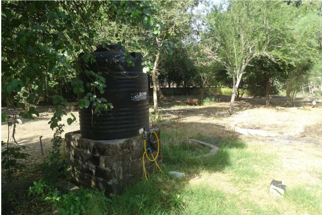
Abb. 20: Die Zisterne zur Versorgung des Perlschlauch-Systems im Schaugarten des CNRD in N'Djamena.