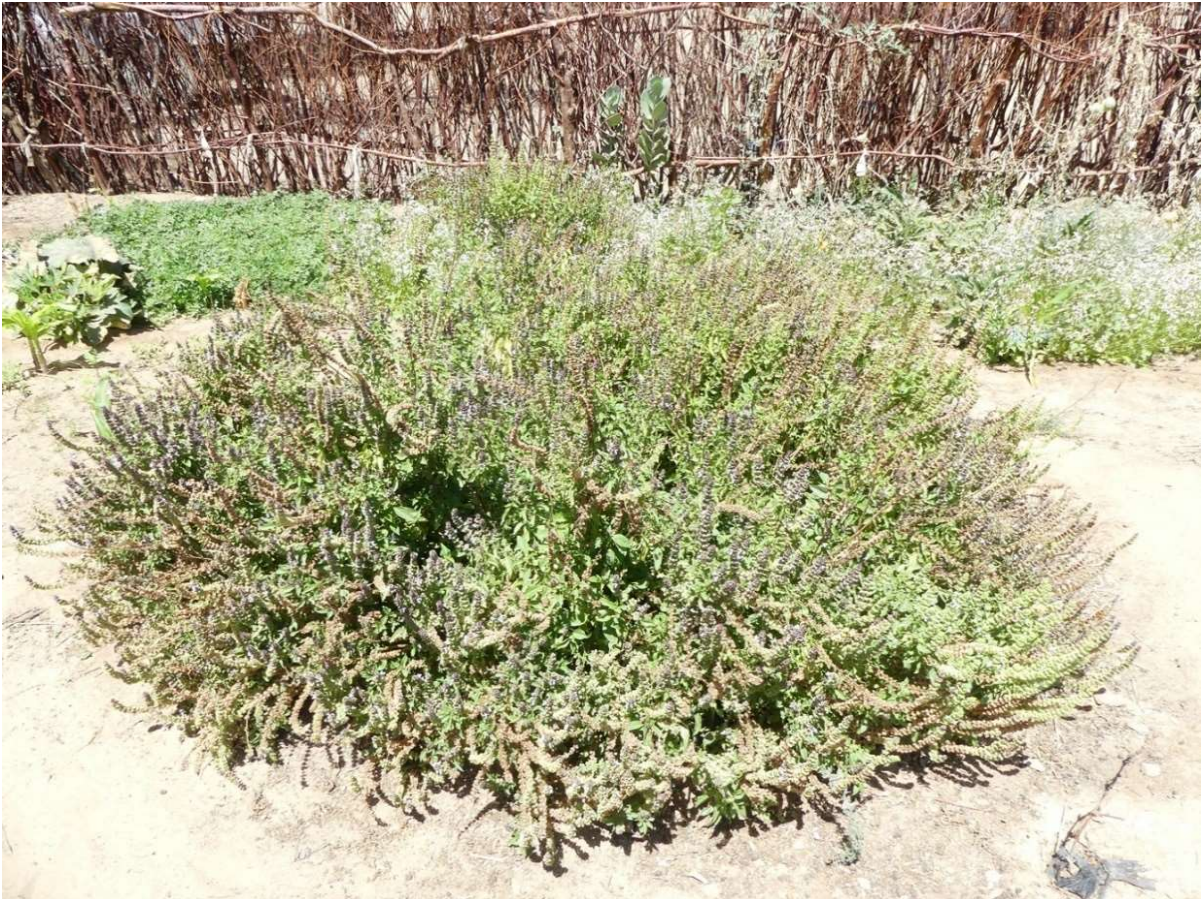
Abb. 28: „Zimtbasilikum“ in einem Garten von Hochi. März 2023.

dann aber wieder verschwand. Der Persische Klee ( Trifolium resupinatum ) als Gründüngung und Viehfutter wuchs dagegen sehr gut, wenngleich er wahrscheinlich nicht die Biomasse produziert, wie es die vor Ort bereits seit längerem gesäte Luzerne (libyscher Herkunft?) tut. Das „Zimtbasilikum“ ( Ocimum basilicum var. cinnamomum ) wächst üppig und eignet sich, wie beobachtet werden konnte, hervorragend, um Bestäuber-Insekten anzuziehen ( Abb. 28 ).