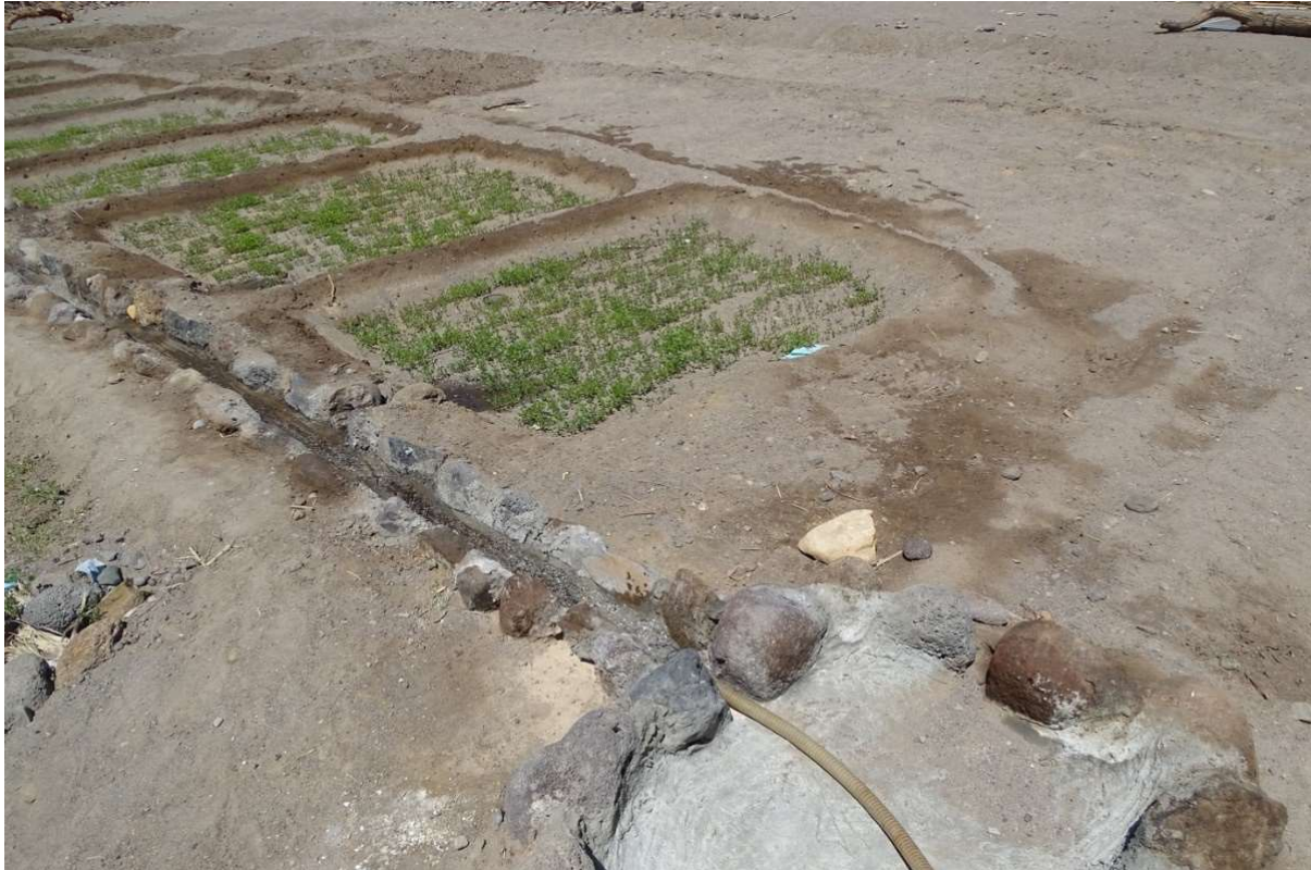
Abb. 18: In Eigeninitiative von einem Gärtner von Odorko zum Erdreich hin abgedichtete Wasserkanäle. Daneben Beete mit Luzerne. März 2022.

Neben der beschriebenen „traditionellen“ Bewässerungsmethode wurde in den Saharagärten versucht, eine Technik zu erproben, die in diesem geographischen Kontext noch nicht im Einsatz ist: die Unterflurbewässerung. Dazu wurden in einem kleinen Teil der Beete Perlschläuche von ecotube verlegt. Diese rundum porösen Schläuche geben Wasser durch Schwerkraft ab, welche durch eine erhöht stehende Zisterne als Reservoir erzeugt wird. Gleichzeitig entsteht durch die Verlegung im Substrat Saugspannung, die zum Austritt von Wasser aus dem Schlauch führt.