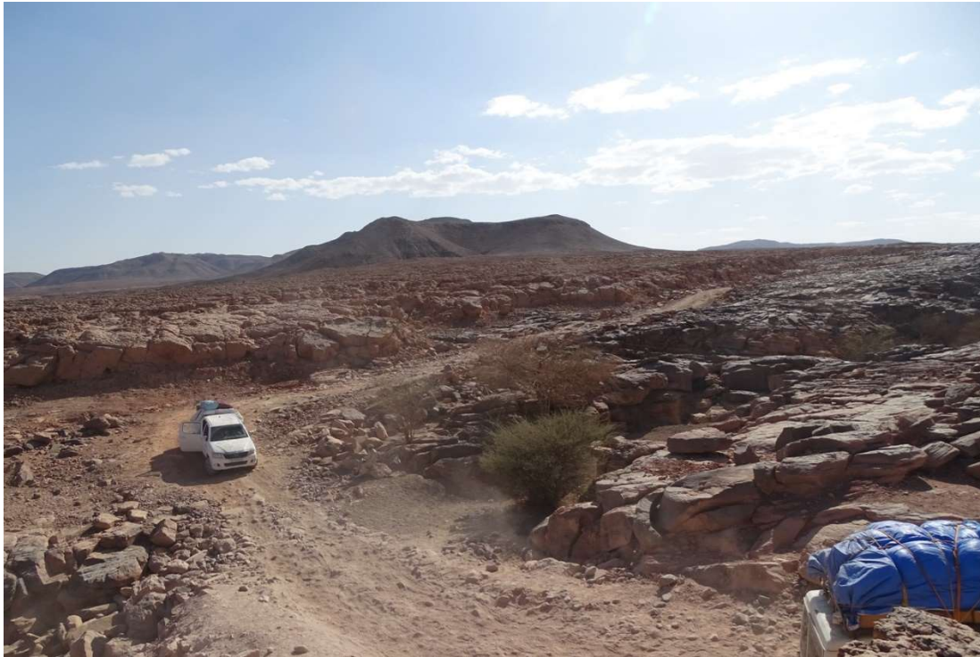
Abb. 30: Die Gebirgsroute zwischen Zouar und Bardai. Oktober 2021.

schweren Zugänglichkeit der Projektstandorte. Material musste über mehr als 1.600 Kilometer auf unbefestigten Wegen – oder überhaupt ohne „Weg“ – durch die Wüste transportiert werden, und Projektstandorte wurden regelmäßig über dieselben Wege aufgesucht ( Abb. 30 ).