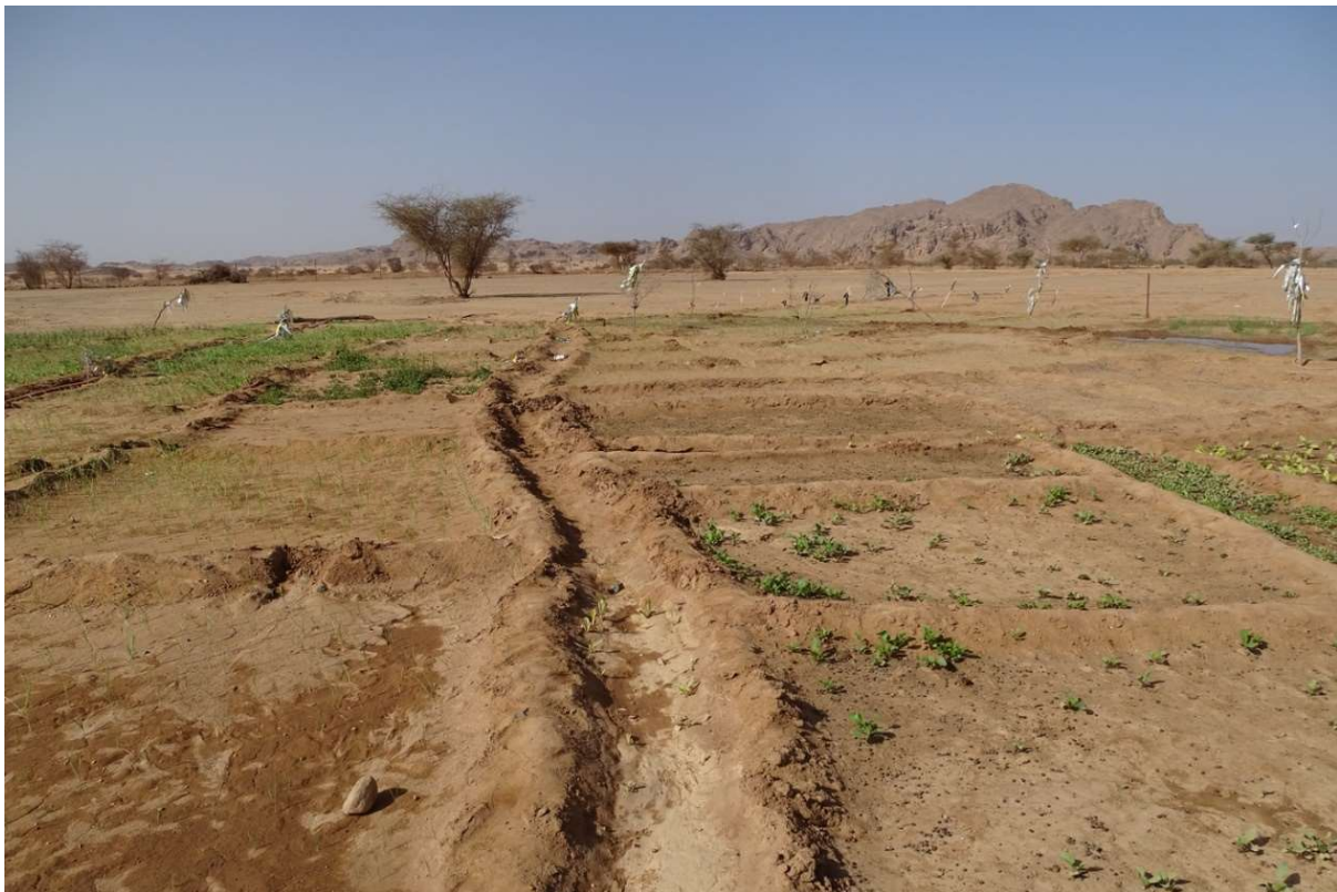
Abb. 16: Beispiel eines nicht nachhaltigen Umgangs mit Wasser in einem Garten in der Umgebung von Bardai: Wasser wird über lange, breite und zum Erdreich hin nicht abgedichtete Kanäle zu den Beeten geleitet. März 2022.

Dieses wird dann über Kanäle zu den Beeten geleitet. Wenngleich arbeitsaufwändig, hat sich der Schöpfbrunnen insofern bewährt, als dass seine Förderleistung stark begrenzt ist. So verleitet er kaum jemanden zur Verschwendung von Wasser, womit auch der Versalzung teilweise vorgebeugt wird. Heute jedoch trifft im Tibesti oftmals die „moderne“ Technik auf „traditionelle“ Methoden. Das heißt, Benzin-Pumpen mit hoher Förderleistung wie die oben genannten werden oft dort eingesetzt, wo die Bewässerungstechniken noch nicht der Notwendigkeit eines sparsamen Umgangs mit Wasser angepasst wurden. Mit solchen Pumpen kann viel Wasser in die ins Erdreich gegrabenen Kanäle gepumpt werden, so dass, wenn auch ein Großteil davon im sandigen Substrat versickert, immer noch genug Wasser zu den Beeten gelangt, um diese damit zu fluten – eine „traditionelle“ Methode, die es heute noch möglich macht, mit geringstmöglichem Arbeitseinsatz und den geringstmöglichen Investitionen zu wässern ( Abb. 16 ). Eine der Herausforderungen des Projektes ist es, einem solchen nicht nachhaltigen Umgang mit Wasser entgegenzuwirken.