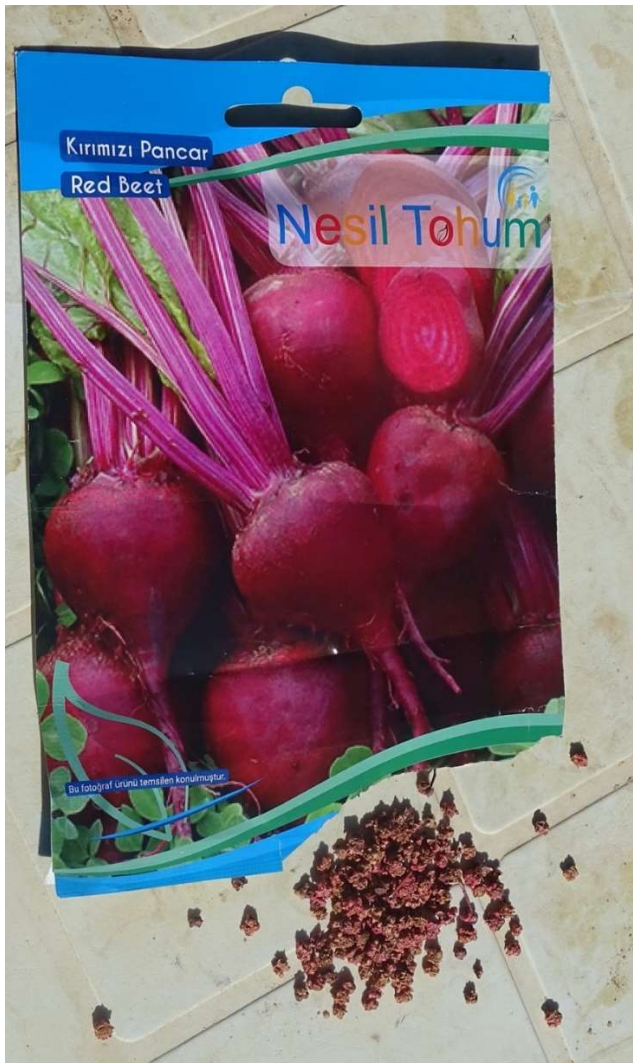
Abb. 23: Gebeitztes Saatgut türkischer Herkunft von Roter Rübe ( Beta vulgaris ). Fada / Ennedi, November 2022.

Tohum , von dem 2022 die Tüte in N'Djamena für 750 FCFA (1,14 Euro) verkauft und in Fada / Ennedi für 1.000 FCFA (1,52 Euro) weiterverkauft wurde ( Abb. 23 ).