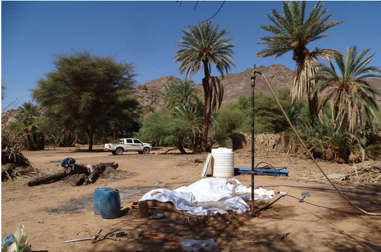
Abb. 13: Anlegen des Bohrlochs von Tanehart. Das Bohrgestänge steht im Loch, Wasser wird über einen Schlauch zugeführt. Die beiden Becken in Bildmitte dienen dem Auffangen und der Klärung des gebrauchten Wassers. Im Hintergrund die blauen PVC-Rohre, mit denen das Loch ausgekleidet werden wird. Oktober 2021.

Boden versunken ist, können weitere Rohre aufgesetzt werden. Ist das Loch tief genug, wird das Bohrgestänge herausgezogen und durch die PVC-Rohre ersetzt. Durch die Bohrung entstandene Hohlräume um das PVC-Rohr sollten mit Kies aufgefüllt werden.