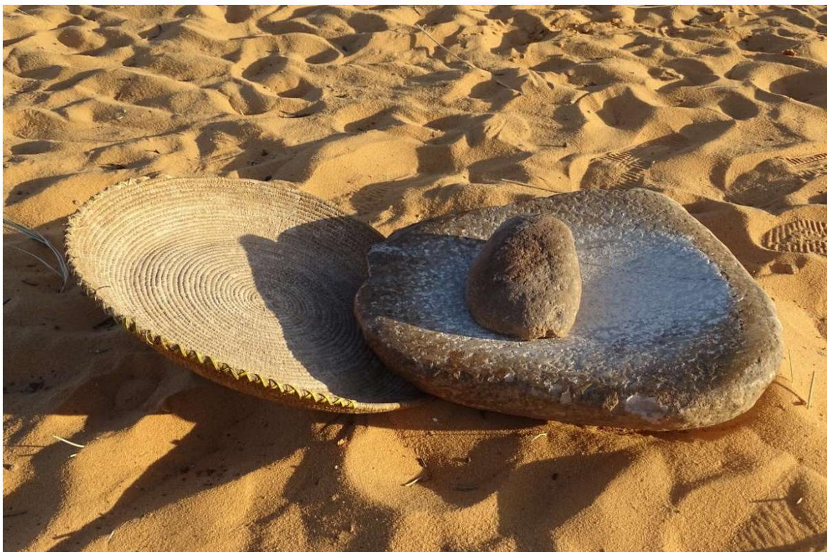
Abb. 31: Kornschwinge, Reibeschale und Läuferstein zur Verarbeitung von Wildgetreide, wie sie heute noch im Ennedi in Gebrauch sind. Nehi / Ennedi, November 2022.

In Zukunft wird es weiterhin notwendig sein, Überlegungen zu Strategien anzustellen, um einer anhaltenden Verknappung des Wassers zu begegnen. So könnte es zum Beispiel sinnvoll sein, zwischen die Zitronenbäumchen und Feigensträucher eines Gartens Wildobst zu pflanzen, wie dies bei einem Gärtner in Fada bereits beobachtet werden konnte. Die „Wüstendattel“ ( Balanites aegyptiaca ), die „Wilde Jujube“ ( Ziziphus spina-christi ), der „Zahnbürstenbaum“ ( S. persica ) oder Akazien ( Acacia sp.) sind weitaus genügsamer und haben weitreichendere Wurzelsysteme als Kulturobst. Sollte es einmal zu trocken für letzteres werden, so können diese Arten weiterhin Blätter und Früchte als Nahrungsmittel, Viehfutter oder Medizin liefern. Unter dem Wildobst könnten dann kleinere Gemüsebeete angelegt werden, für die das vorhandene Wasser noch ausreichen mag. Und sollte es auch dafür einmal zu trocken werden, dann wäre an Wildgetreide (z.B. Aristida pungens , Panicum turgidum ) oder an Koloquinten ( Citrullus colocynthis ) zu denken, deren Samen früher in den Tälern des Tibesti von den Einwohnern gesammelt wurden, und die in der Provinz Ennedi immer noch Verwendung finden ( Abb. 31 ).