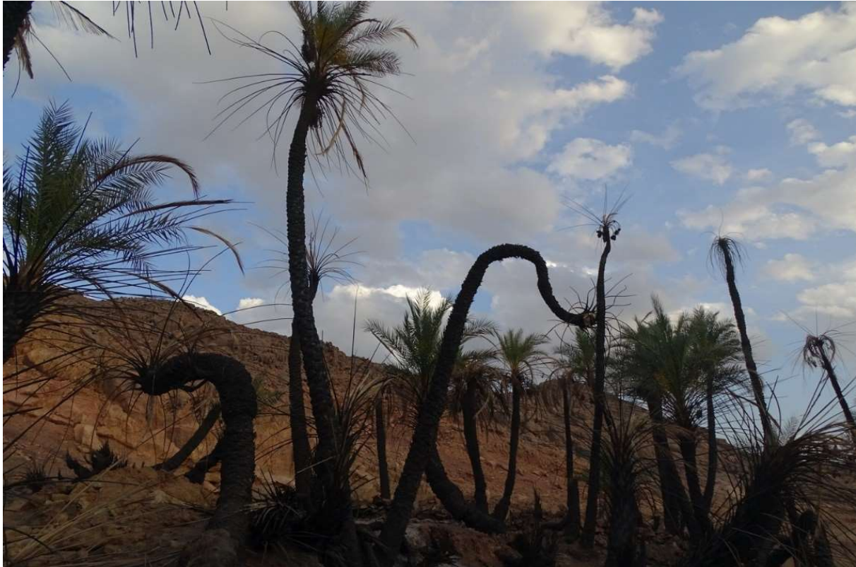
Abb. 10: Ein Teil des Dattelhains von Aouzou nach dem Brand. März 2021.