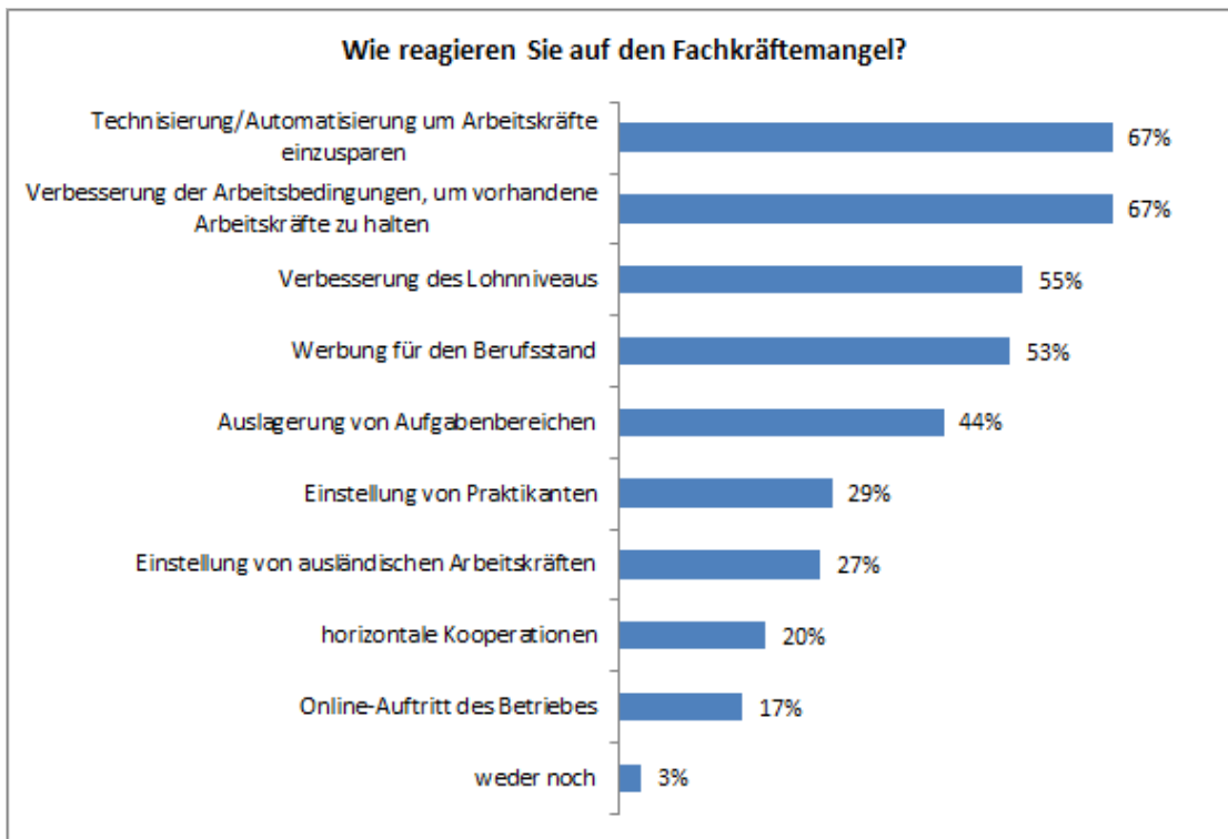
Abbildung 2: Häufigkeiten von Reaktionen auf Fachkräftemangel (Mehrfachnennungen möglich, n = 294).

Die Betriebsleiter, die bereits Probleme bei der Stellenbesetzung haben (n = 66), wurden zudem befragt, wie sie auf den Fachkräftemangel reagieren. Die Ergebnisse hierzu sind in Abbildung 2 dargestellt (Mehrfachnennungen möglich). Der Großteil der Betriebsleiter setzt auf die Verbesserung der Arbeitsbedingungen, um die vorhandenen Arbeitskräfte zu halten oder auf die Technisierung oder Automatisierung, um Arbeitskräfte einzusparen (jeweils 67 Prozent). Zu weiteren wichtigen Maßnahmen, die von den Betriebsleitern umgesetzt werden, zählen die Verbesserung des Lohnniveaus (55 Prozent), Werbung für den Berufsstand (53 Prozent) und die Auslagerung von Aufgabenbereichen (44 Prozent). Seltener wird versucht, das Fehlen von Fachkräften durch die Einstellung von Praktikanten (29 Prozent), die Einstellung von ausländischen Arbeitskräften (27 Prozent), durch horizontale Kooperationen (20 Prozent) oder einen Online-Auftritt des Betriebes (17 Prozent) auszugleichen. Drei Prozent der Betriebe geben an, keine der genannten Maßnahmen zu ergreifen.