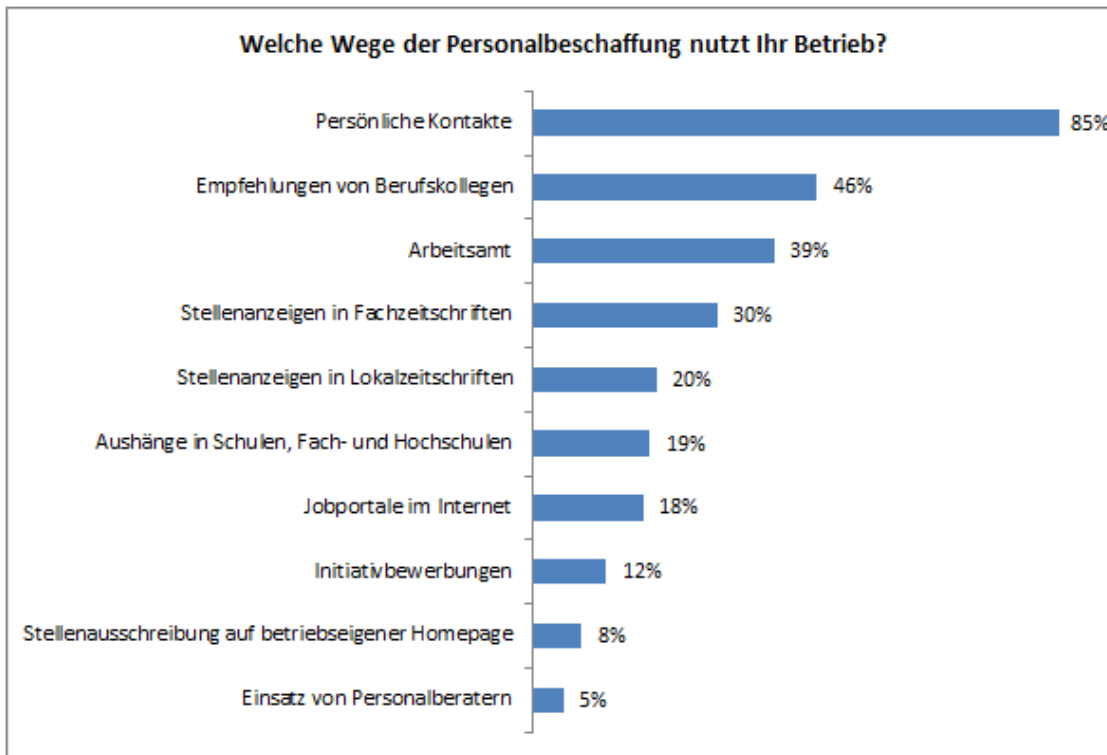
Abbildung 4: Häufigkeiten des Einsatzes verschiedener Möglichkeiten der Personalbeschaffung (Mehrfachnennungen möglich, n = 294).

betriebseigenen Homepage, das Hinzuziehen von Personalberatern oder Initiativbewerbungen werden fast gar nicht bei der Personalbeschaffung eingesetzt. Als sonstige Möglichkeiten der Personalbeschaffung wurde von den Betriebsleitern insbesondere noch die Stellenvermittlung über die Landwirtschaftskammern und -ämter (n = 7) oder die betriebseigene Ausbildung (n = 3) genannt.